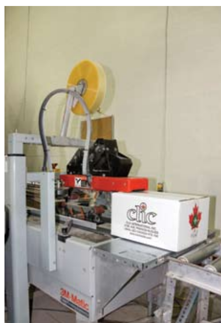
Une unité de scellage de caisses 3M.