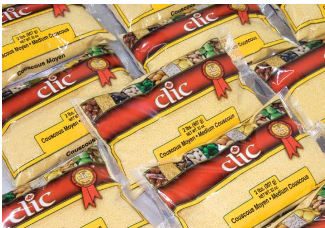
Sacs de produits Clic. (Pentaflex)