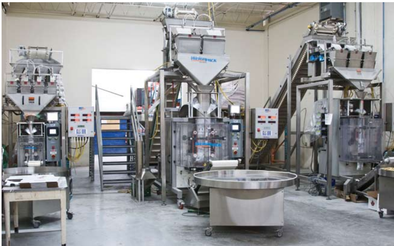
Au centre, l'ensacheuse verticale automatique WeighPack sur laquelle sont conditionnés les sacs de 10 kg.

L'univers industriel est fascinant à plus d'un titre. On y produit des biens de toutes sortes destinés à une foule d'usages. On y emploie des travailleurs aux compétences de plus en plus pointues. Les défis y sont nombreux, pour ne pas dire quotidiens dans bien des cas. Mais, plus que tout autre chose, cet univers est un creuset d'innovation à nul autre pareil. Parfois de façon spectaculaire, parfois de façon tout à fait anodine, ces innovations transforment notre quotidien. Un peu comme le fait depuis quelques mois déjà Clic International avec une toute nouvelle ensacheuse verticale qui remplit à notre plus grand étonnement des sacs de 10k g d'une genre tout nouveau.