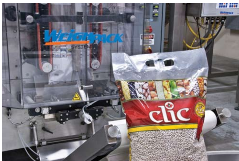
Les sacs de légumineuses de 10 kg avec poignée.