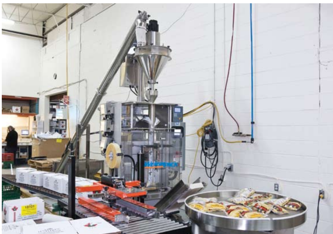
Une des quatre ensacheuses automatiques WeighPack utilisées par Clic International.