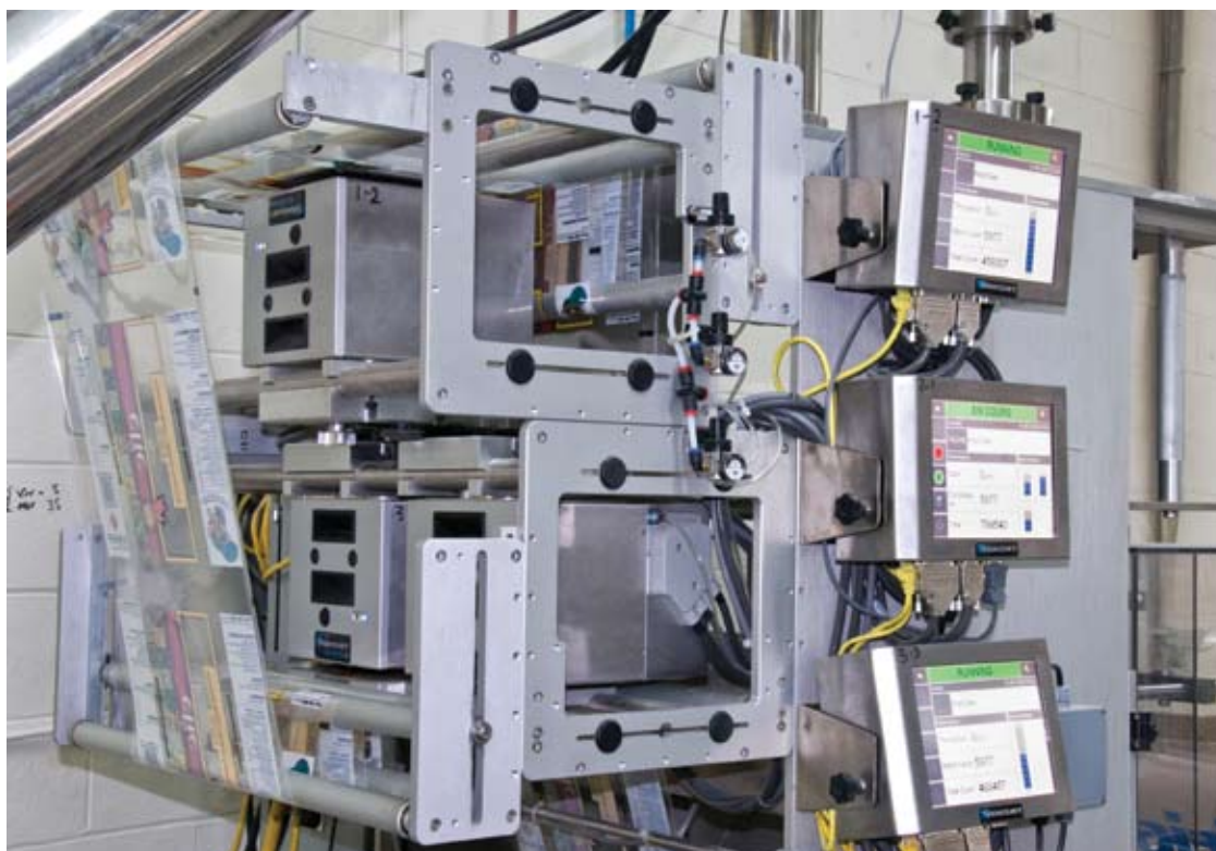
Panneaux de contrôle d'imprimantes Videojet.

En raison de la présence de cette poignée, ce sac de 10 kg est sans nul doute promis à un fort bel avenir. Déjà, Clic International se spécialise dans l'emballage sous étiquette privée et offre tout les formats existants aux institutions, aux grossistes, et aux chaînes. De plus, il l'écoule en grande quantité auprès de ses diverses clientèles issues du secteur de l'alimentation comme de celui du secteur HRI (hôtellerie, restauration, institution) où «il a été bien reçu, les gens trouvant utile cette poignée qui se trouve sur nos nouveaux sacs de 10 kg.»