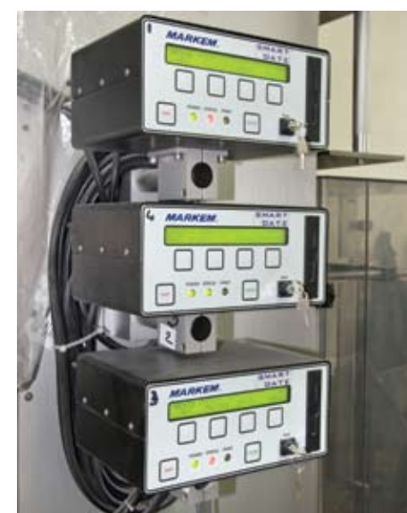
Les codeurs à date Markem. Image d'une des quatre ensacheuses verticales qu'utilise Clic International.